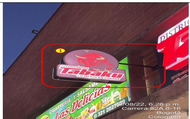
Elemento de PEV, el cual se encuentra volado de la fachada de la edificación.