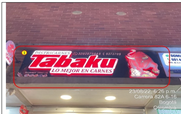
Elemento de publicidad tipo aviso en fachada, el cual no cuenta con registro de publicidad exterior visual de la SDA.